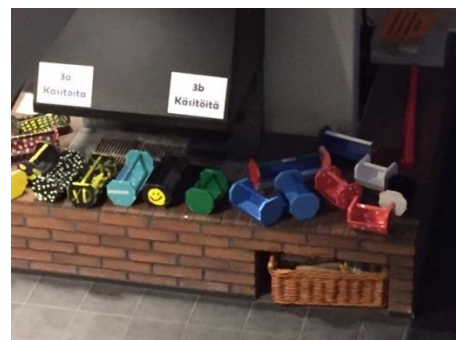
Kuvataidetta, tilkkumaalausta, puutöitä