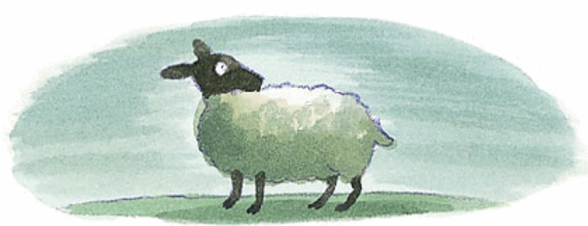
Emma Chichester Clark: Enchantment: Fairy Tales, Ghost Stories and Tales of Wonder, 2000