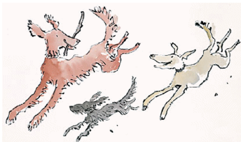
Quentin Blake: Ten Frogs, 1998