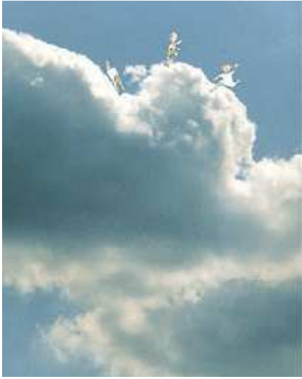
John Burningham: Cloudland, 1996

Miten taiteilija on tehnyt teoksen? Mitä välineitä hän on käyttänyt kuvan tekemiseen?