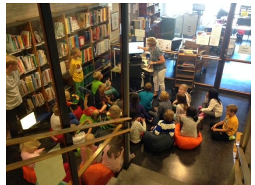
Kirjasto-opastusta ja ryhmäytymistä monin keinoin.