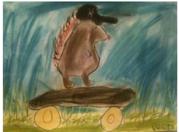
Tunteelliset siilit vauhdissa, oppilastöitä 4a ja 4b