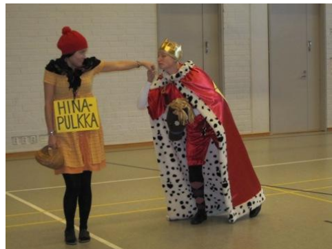
Hinapulikka ja Rinssi aloittivat lukukuun!