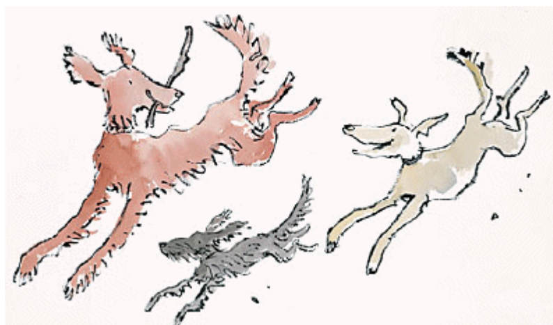
Quentin Blake: Ten Frogs, 1998